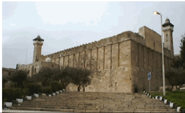
Macpela, las tumbas donde están los Patriarcas y las Matriarcas

10 Tomó Abram todos estos animales, los partió por la mitad y puso cada mitad enfrente de la otra; pero no partió las aves. 11 Y descendían aves de rapiña sobre los cuerpos muertos, pero Abram las ahuyentaba. 12 A la caída del sol cayó sobre Abram un profundo sopor, y el temor de una gran oscuridad cayó sobre él.