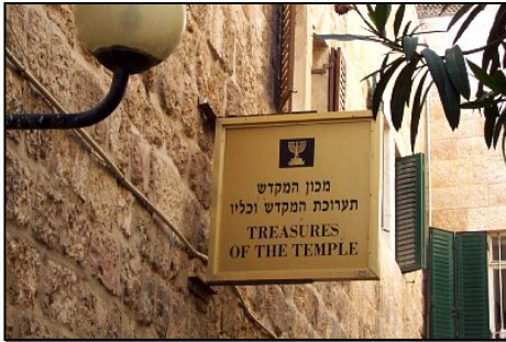
Институт горы Храма хранит сокровища Храма для третьего Храма .

Итак ,когда увидите мерзость запустения ,реченную через пророка Даниила ,стоящую на святом месте , - читающий да понимает» (Матфея 24:14-15).