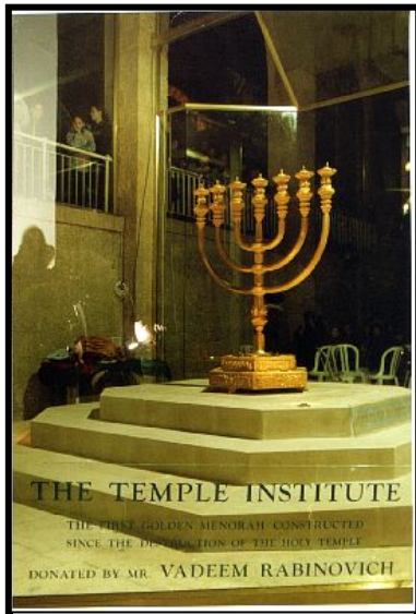
Менора,приготовленная для третьего Храма